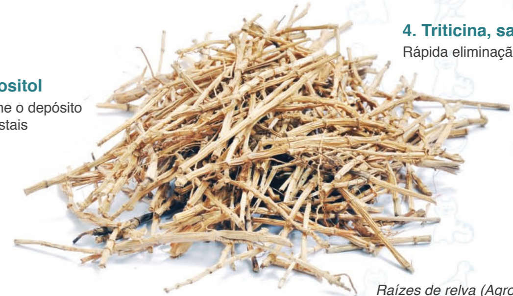
Raízes de relva ( Agropyron repens )